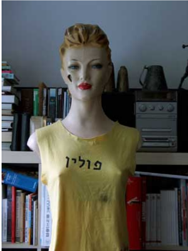
Kolekcja Joanny Rajkowskiej