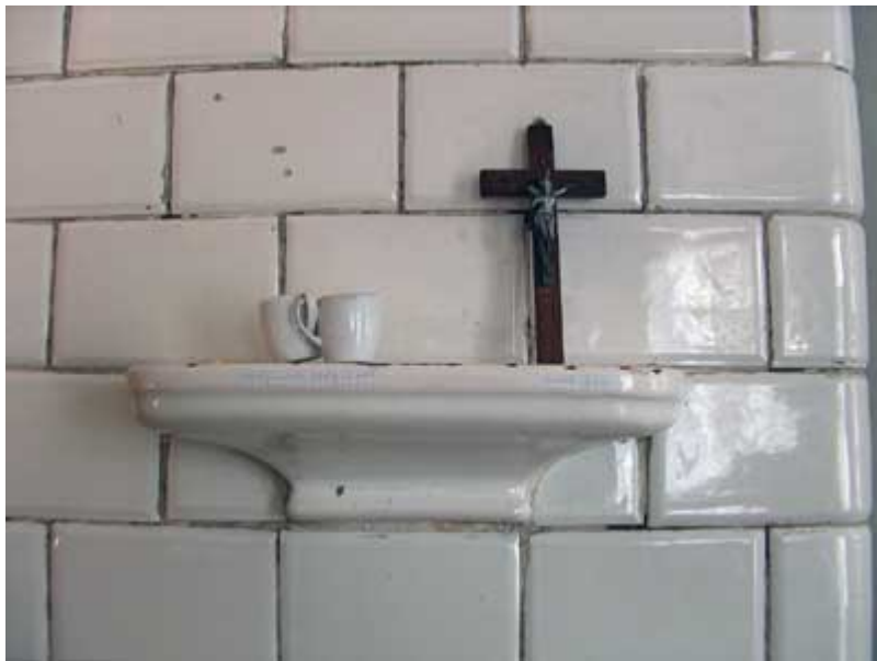
Sławek Belina, "Pedały wiodą pustą żywot", "Double Jesus", 2006