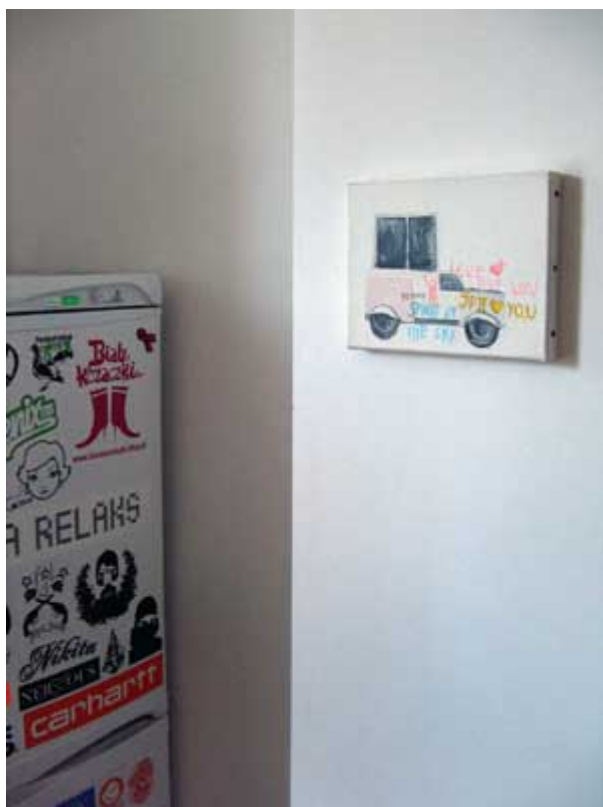
Malwina Konopacka, "Papamobile", 2006

dobrze wpisało się w zastaną przestrzeń, świetnie funkcjonując w przestrzeni prywatnej.